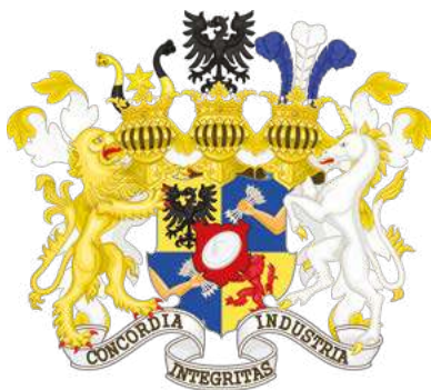
► Stemma della famiglia Rothschild.

I gruppi bancari dei Rothschild e dei loro soci (la cupola o mafia finanziaria), con sede a Londra e Parigi, finanziano lo sviluppo dell'Impero inglese e dell'Impero francese (sono loro che finanziano le guerre di Londra e Parigi ottenendo guadagni colossali).