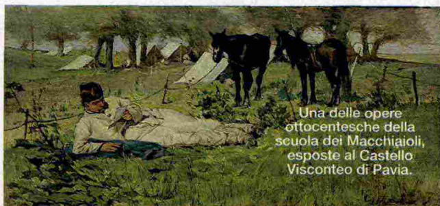
Una delle opere ottocentesche della scuola dei Macchiaioli, esposte al Castello Visconteo di Pavia.